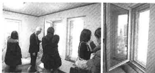
↑ 2重サッシに興味深々 ・ ↓ 旧小熊邸