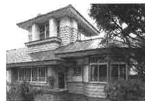
駒木邸(撮影：安達治氏、 坂牛邸(写真提供：安達治氏) 提供：小樽市教育委員会)