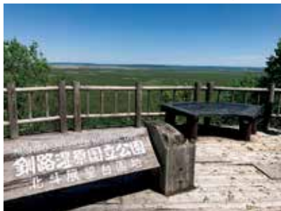
サテライト展望台

一周2.5kmの遊歩道です。「散策後に丹頂ソフトをいただく！」と楽しみにしていたのですが、お店がお休みでした。残念！