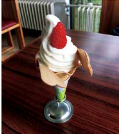
丹頂の形のソフトクリーム

一周2.5kmの遊歩道です。「散策後に丹頂ソフトをいただく！」と楽しみにしていたのですが、お店がお休みでした。残念！