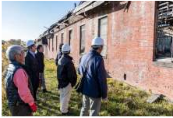
現在の建物の現況を確認する、建築士