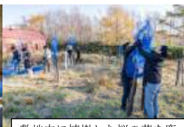
敷地内に植樹した桜の芽を鹿に食べられないようにネットを巻きを手伝いました。