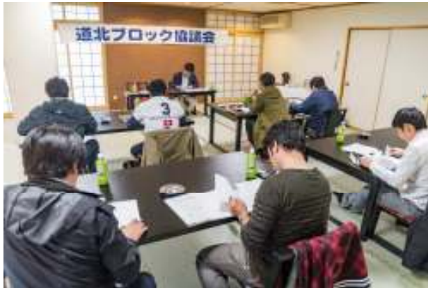
第3回ブロック協議会の様子