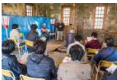
説明に耳を傾ける建築士