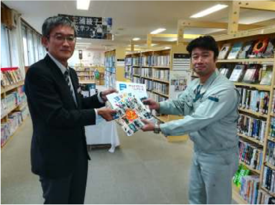
地域図書館へ児童用建築絵本寄贈。