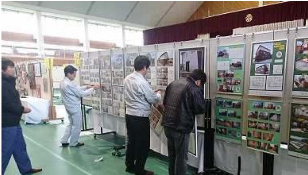
町の文化祭、住宅パネル展示。