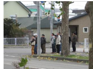
役場から消防まで町歩き？