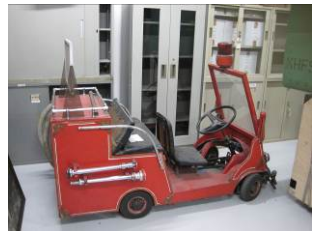
子ども向けアイテムも常備