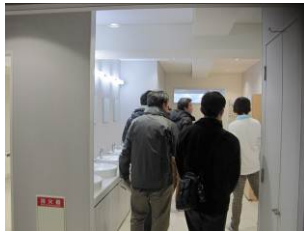
ユーティリティも充実の装備