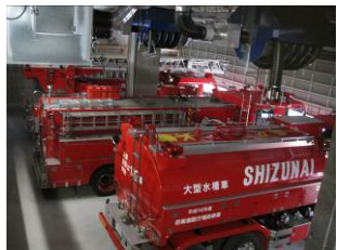
火災の発生に備え休養中