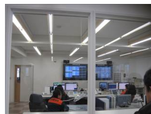
道内でも最先端の通信指令室