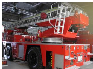
近くで見ると迫力が・・・