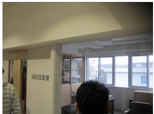
消防団長室（不在でした）