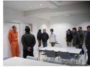
通信室の奥には食堂