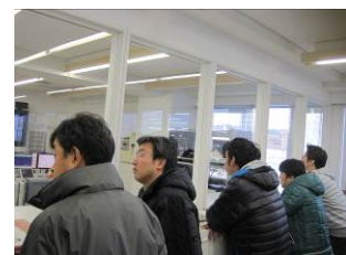
とりあえず外から見学中