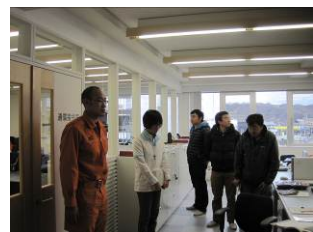
通信指令装置の説明を受ける