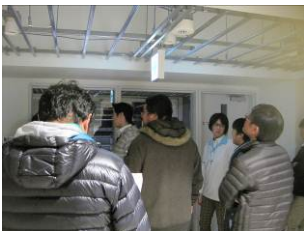
天井を貼る予算が・・・