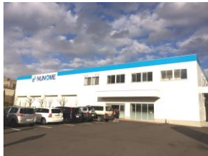
新社屋及び工場 (正面)