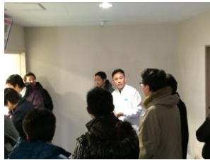
説明を受けながら見学