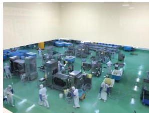
作業中風景 (1区画目)