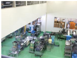
作業中風景 (2区画目)