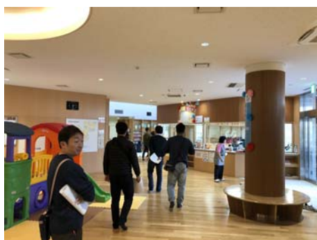
児童センター部門の見学