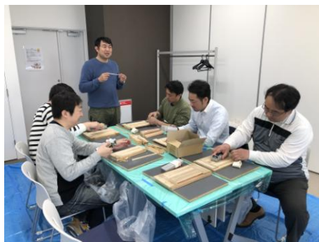
協議会風景（箸一次加工）