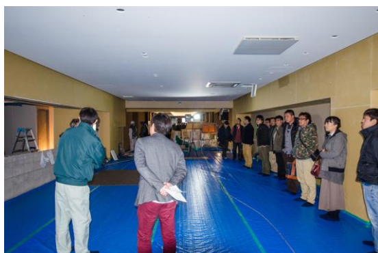
【現場責任者による説明】

高級ラグジュアリーコンドホテルとして12月にオープン予定の綾ニセコ 工事現場に見学に行きました。オープン後には中々見ることの出来ない高級ホテルの現場に見学者一同ため息が漏れていました。