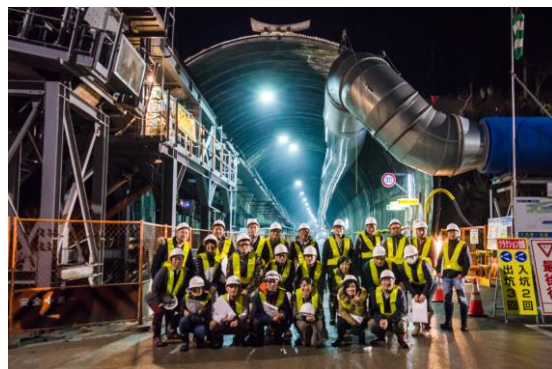
【入り口にて記念撮影】