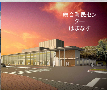
総合町民センター はまなす