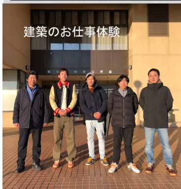
建築のお仕事体験

えりも町 ”海と大地のふるさと”えりも町 心豊かで安心・安全な暮らしを創る。新まちづくりデザイン