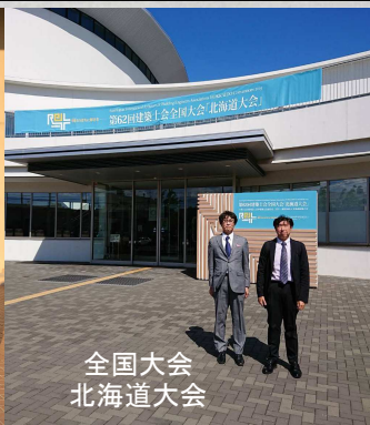
全国大会 北海道大会