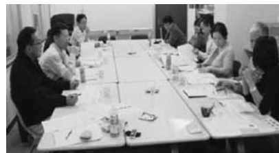
(11月12日の委員会開催状況)

会員の皆様には、「道風便」を活用することで、支部情報やイベント・建築情報(広告・各種情報など)が提供していくことが出来ると思っております。