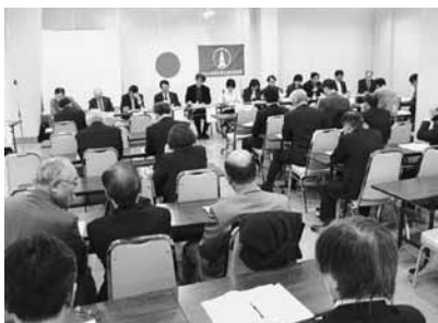
通常総会「札幌テレビ塔」