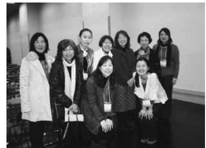
パワー充電中…全建女にて

北海道建築士会女性委員会は毎回参加し、活動報告も積極的にしてきました。これからも、全建女で報告することを目標に、活動の巾を広げていきたいと思っております。