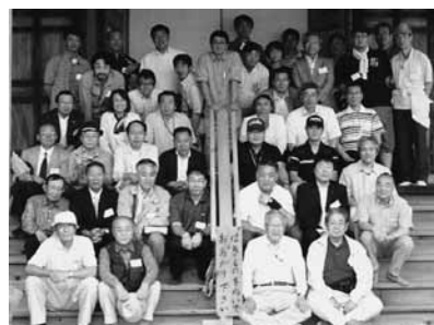
【第32回青函松交流会の様相】