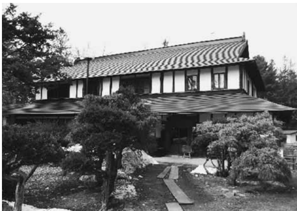
にじます料理専門店「松久園」

私の住む芽室町には築97年の建物でにじます料理店を営業する「松久園」があります。「松久園」は平成18年に「芽室遺産」の指定を受けた町民から大切にされている貴重な建物です。めむろ建築・まちづくり研究会は国土交通省の委託を受け「松久園」を初めとする芽室町の歴史的建築物の調査を進めています。調査に着手した頃、「ヘリテージ・マネジメント専門職育成講座」の案内が届きました。「ヘリテージマネージャー」