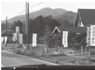
除染作業中の旗～車中より撮影

地に建てて計測した結果、ある程度の遮蔽効果がある数値が得られた。当日の参加者には、この過程を編集した冊子が配布された。また、放射能のリスクを気にしている方の参考に活用してほしいと、報告を締めくくった。