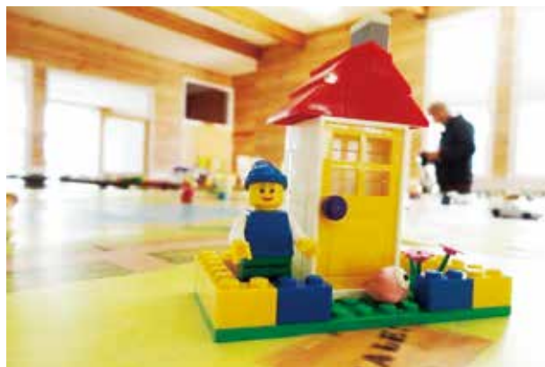
ブロックで「まちなみ」をつくってみよう

「おりがみでたてものをつくってみよう」では、折り紙の建物の絵に自由に着色してから、定規とカッターを使い切り抜き、折り目をつけて立体的な建物をつくってもらいました。