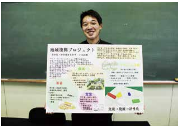
地域復興プロジェクト空地空き家を生かす4大計画