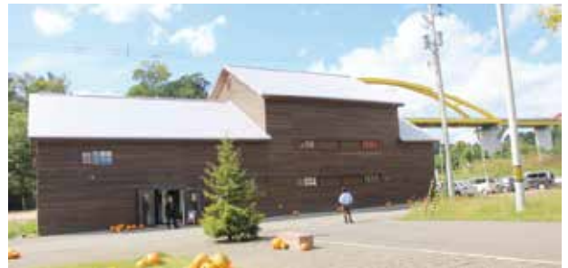
H26 改修前のデンポン工場（上）改修後（下） 平成29年全道大会B分科会見学会場となった。