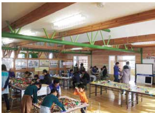
イベント会場 全景

本イベントは、本部青年委員会が毎年行っている「建築士の日」の周知イベントを模したもので、今回はその中から「ブロックでまちなみをつくってみよう」、「おりがみでたてものをつくってみよう」、「パズルでお部屋をかんがえよう」の3つのお仕事体験と「紙で人を支えられるのか」のライブイベントを行いました。各お仕事体験に参加した子どもたちには、お給料として会場内に設置している駄菓子屋で使用できるイベント通貨「チーク」を手渡し、お仕事の達成感を体験してもらいました。また、お仕事体験を1つ終了するごとにスタンプを押し、5つのスタンプを集めた子どもには、記念として「こども建築士免許証明書」の発行を行いました。