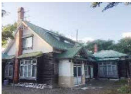
H29 美唄市・H邸