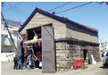
H28 札幌市・北海道神(仮称)東北祭典区山車蔵