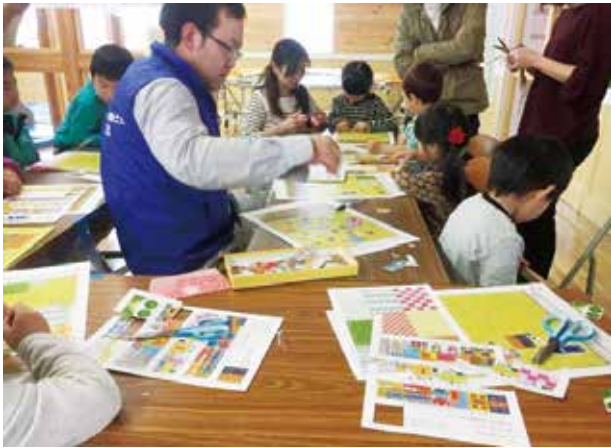
パズルで「お部屋」をかんがえよう

使用する材料は付箋と同様の仕様のもののでできており、床材や家具は自由に剥がせるものなので、子どもたちは何度も貼ったり剥がしたりを繰り返し、納得がいく間取りができるまで試行錯誤していました。それにより完成したお部屋は、機能性を重視した現実性の高いものから大人では考え付かない芸術性に富んだデザインなものまで、多種多様な作品ができて上がりました。