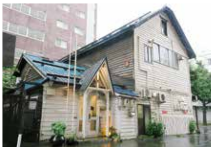
H28 札幌市・複合店舗KAKUイマジネーション