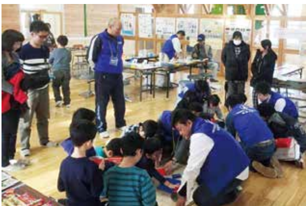
紙で人を支えられるか？

「紙で人を支えられるか？」は、紙で柱と壁を作り、配置を考えます。その上に90cm角のクリアパネルを重ね、子ども達が何人乗れるか実験しました。2チームに分かれた子ども達は思い思いの柱、壁を作成し、どのように配置したら人がたくさん乗れるか競い合いました。15人もの子どもが乗れる構造体を作成したチームもあり、潰れるときには大きな歓声があがりました。