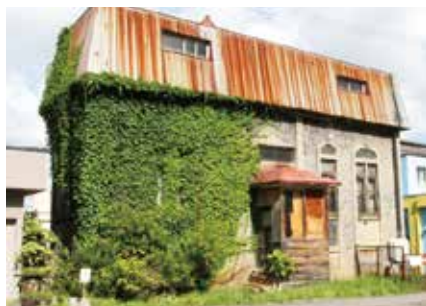
H29 小樽市・旧丸ヨ石橋別邸