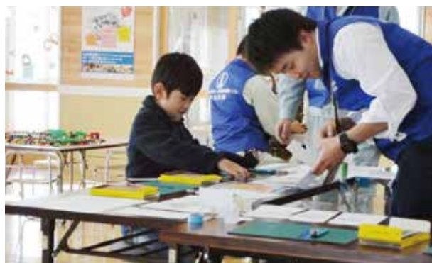
おりがみで「たてもの」をつくってみよう

カッターを使った細かい作業が多く、子どもたちの慎重に取り組んでいる姿が見られました。一つ二つと作成しているうちに要領をつかんできた子どもは難しい建物にも挑んでいきました。