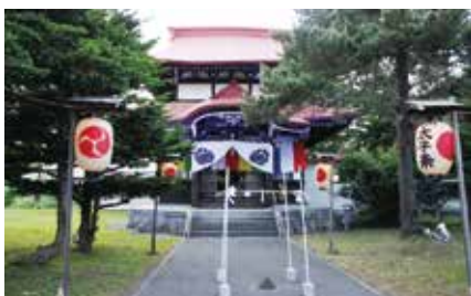
深川市・澄心寺太子堂 重層の太子堂は道内唯一

深川市の秋祭り。壮麗な神輿が二基巡行し、御旅所(?)と境内で無形文化財の舞踊も披露される。