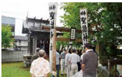
当別町・当別神社境内社聖徳神社

深川市の秋祭り。壮麗な神輿が二基巡行し、御旅所(?)と境内で無形文化財の舞踊も披露される。