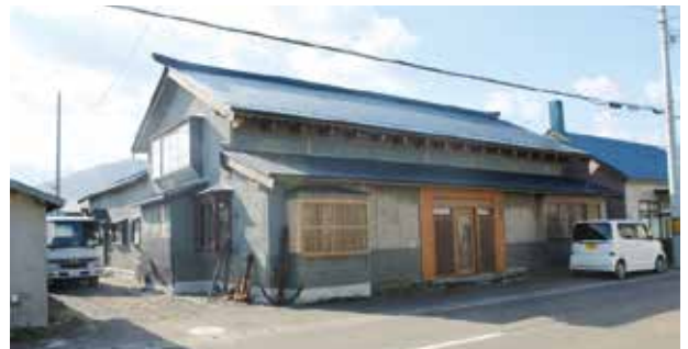
H26 小樽市・銭函Y邸 元漁業親方の自宅 調査で地名にゆかりがある建物をみつけた。