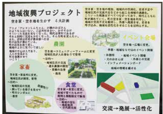
北海道札幌工業高校