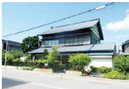
H28 函館市・T邸