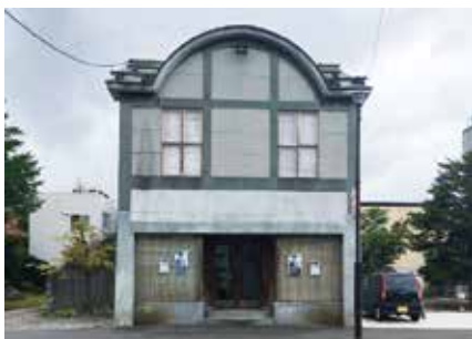
H29 札幌市・行啓通旧石谷商店