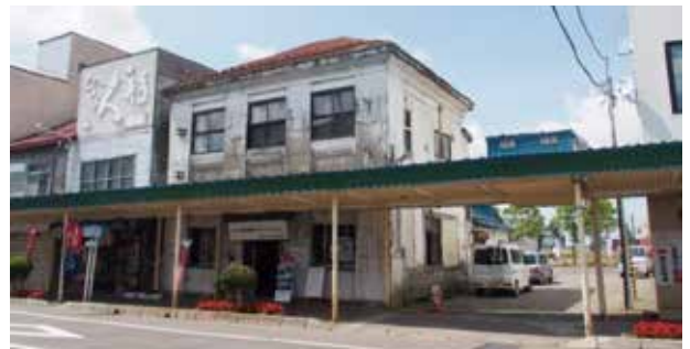
H27 岩見沢市 そらち炭鉱の記憶マネジメントセンター