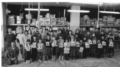
【親子ふれあい工作室】

この新型コロナウイルスという経験をした事がない状況で、なかなか明るい話題が見つかりませんが、終息した時には笑いながら会える事を楽しみにし、それまではおとなしく家でビールを飲んでいたいと思います。