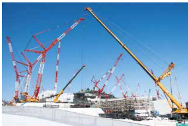
国内最大級の850tクレーンが登場

新球場建設に注目が集まっておりますが、交通渋滞緩和のアクセス道路、水道、下水道、環境保全、既存の駅改修、新駅の整備また関係機関との調整などたくさんの課題をクリアしながら、現在は昼夜を問わず工事が進められています。少しずつ完成に向かう新球場の様子に注目してください。