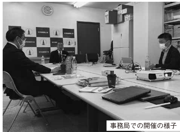
事務局での開催の様子

初めてのオンライン開催で、進行や機器のセッティングミス、通信の不具合もある中皆様にご協力いただき、無事終えられた事に感謝申し上げますと共に、来年は皆様にお会いして開催出来ることを願い、ご報告いたします。