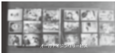
④ポケットタイプのアルバムに収める

最初は人別に収めようと思いましたが、撮影年ごとに(緩めに)並べることにしました。今後も増えていきますし、気に入った写真はデータではなく、アルバムなどで直ぐに見られるようにしたいので、追加が簡単なようにしました。