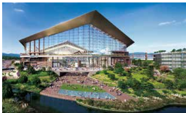
新球場名 エスコンフィールドHOKKAIDO