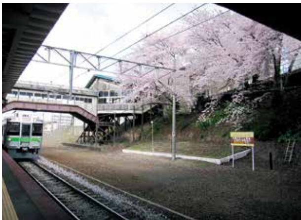
J R 南小樽駅舎と跨線橋を陸橋から望む

現駅舎は昭和33年(1958)の建設。レトロモダンなRC平屋の駅舎とホームを結ぶ鉄骨・板張りの跨線橋、電車は線路に覆い被る桜のトンネルを通り抜けてゆき、陸橋からは咲き誇る桜との共演を楽しめます。現在バリアフリー工事中でこの跨線橋と桜の眺めも今春で見納めのです。