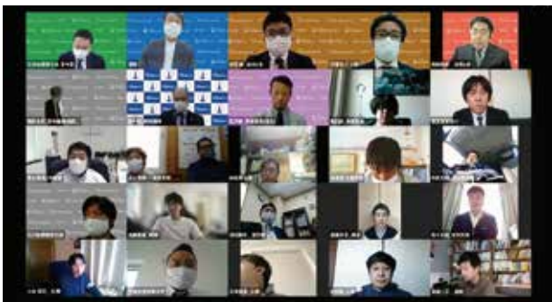
連絡会議Web開催の様相

3月27日、毎年3月に行われる連絡会議を2年ぶりに開催しました。昨年の連絡会議は、新型コロナウイルス感染拡大に伴い中止。今年も感染が治まっていないことから青年委員会の事業では、はじめてのWeb開催となりました。今回の連絡会議には、全道各地より青年委員40名がWebで参加しました。