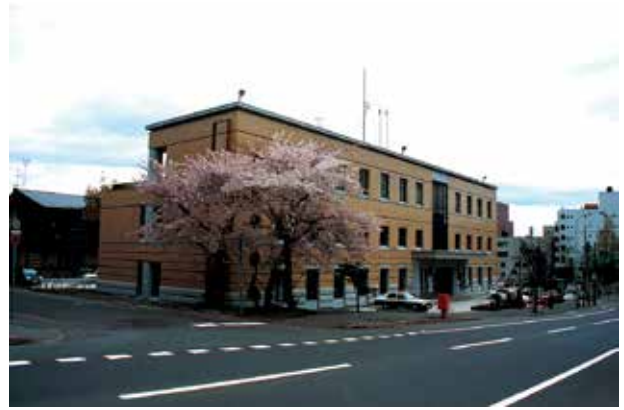
小樽警察署と地獄坂※

小樽は坂の街、数多くの坂の中でも「地獄坂」は一度聞いたら忘れられない名前でしょう。小樽駅近くにあるこの坂の途中には警察署、税務署、法務局が並んでいました。現在は警察署のみになりましたが、庁舎の前庭の桜は小樽でもいち早く咲くことで