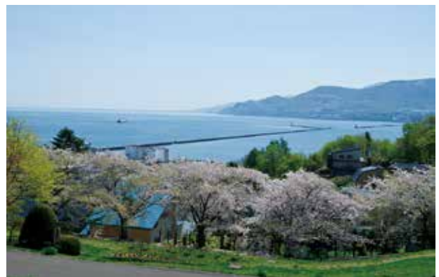
手宮公園と北防波堤※

小樽港を一望する高台に位置し、明治43年(1900)に開設されました。小樽市重要眺望地点に指定されています。遠くは石狩湾を望み、公園一帯が桜に覆われる景色は圧巻です。港を特徴づけている北防波堤は、コンクリート製の日本初の本格的な外洋防波堤として11年の歳月をかけ明治41年(1908)に完成し、現在もその役割を果たしています。