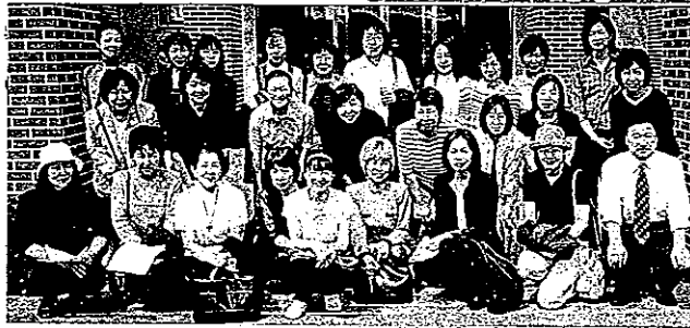
幕別百年記念ホール

次に向かった生涯学習センターでは 設計者が札幌から駆けつけて下さり 建築に対する熱いお話を講演して下 さいました。それぞれの立場で熱心 な見学のあとは、記念撮影。帯広へ向 かいました。北海道で初めての試み である屋台村で昼食をとり解散と なりました。